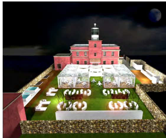
Figg. 4/8. Rendering progettuale della sistemazione esterna