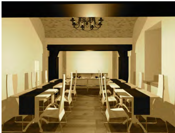
Figg. 9/12. Rendering progettuale della sistemazione interna